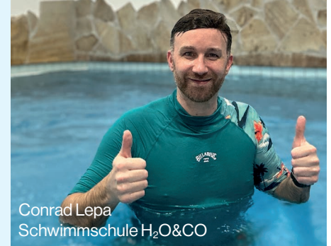
Conrad Lepa Schwimmschule H 2 O&CO

Seit ca. 1,5 Monaten sind wir mit der Schwimmschule H 2 O&CO aus Hopsten jetzt Partner des VfRG e.V. und sind sehr froh darüber, mit diesem Rehasport-Verein zusammenarbeiten zu dürfen. Von Minute 1 an fühlen wir uns hier sehr gut aufgehoben. Der VfRG übernimmt für uns organisatorische Arbeiten, die uns im operativen Geschäft entlasten. Hier sei exemplarisch die Mitgliederverwaltung genannt. Natürlich liegt uns jeder einzelne Teilnehmer am Herzen, jedoch verbirgt sich hinter jedem ein organisatorischer Berg an Arbeit. Der VfRG unterstützt uns u. a. durch die Bereitstellung einer Software, bei der die Teilnahmen der Patienten digital und geschützt über den VfRG an die Krankenkassen weitergeleitet werden.